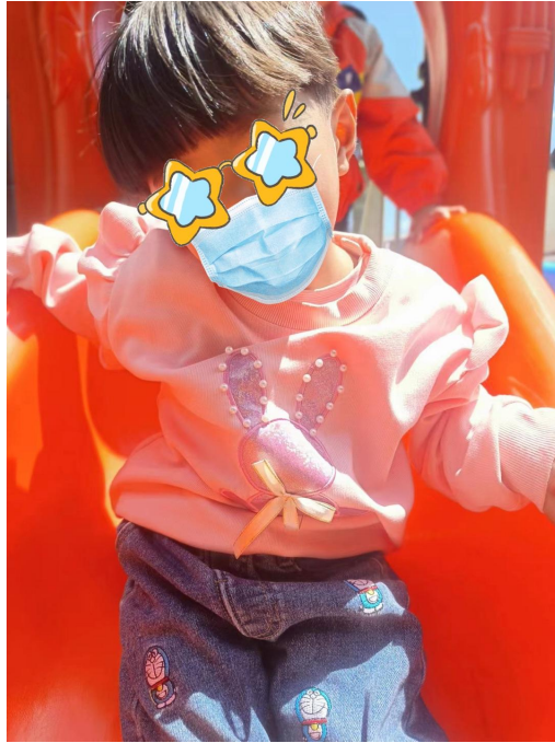
(小芸现在已经上幼儿园啦)