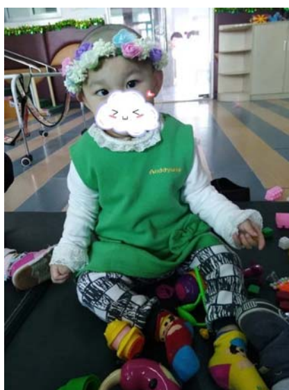
荣荣丰富多彩的生活