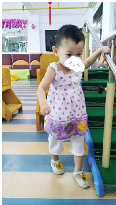
荣荣学着自己走路